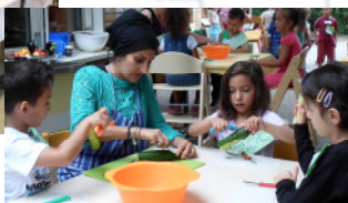
Eine Station beim Sommerfest: gesunde Ernährung

Die Kita Ramlerstraße bot am 7. August den Rahmen für einen Pressetermin zum Landesprogramm mit der Senatorin Frau Scheeres. Das zeitgleich stattfindende „Gute gesunde Sommerfest“ regte die Kinder der Kita-Ramlerstraße sowie die eingeladenen Gäste zum Spielen, Bewegen und Experimentieren an und vermittelte den anwesenden Gästen dabei einen Eindruck von den vielfältigen Möglichkeiten der Bildungs- und Gesundheitsförderung in Kitas.