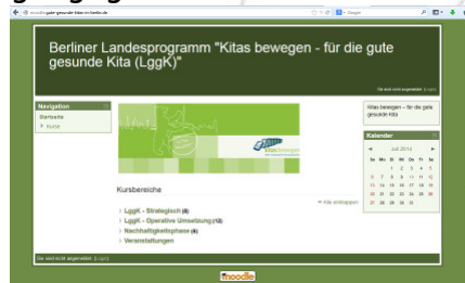
Moodle-Plattform des LggK

richtete Moodle-Austauschplattform wurden eingeführt. Die Online-Plattform ermöglicht es, Schulungsmaterialien, Protokolle, Begleitmaterialien und Leitfäden zur Umsetzung des Landesprogramms transparent zur Verfügung zu stellen. Darüber hinaus bietet es die Möglichkeit, dass sich die Programmbeteiligten über ein Nachrichtenforum vernetzen können.